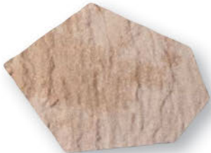
ジュートベージュ