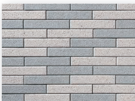
シロンミスト×スーペリアグレー (1:1)