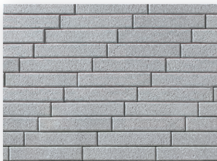
スーペリアグレー