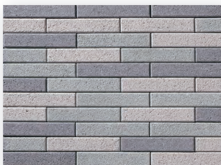
シロンミスト×スーペリアグレー× ディープグレー (1:1:1)