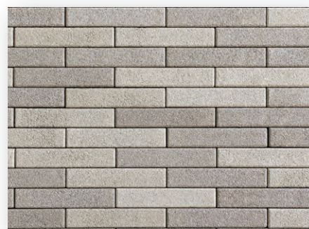
オリーブベージュ×モカベージュ (1:1)