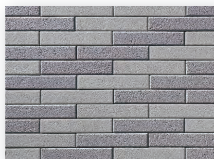
スーペリアグレー×ディープグレー (1:1)