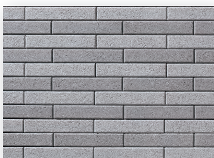
スーペリアグレー×ディープグレー