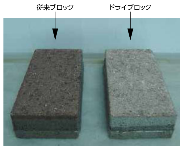
24時間後の吸水状況