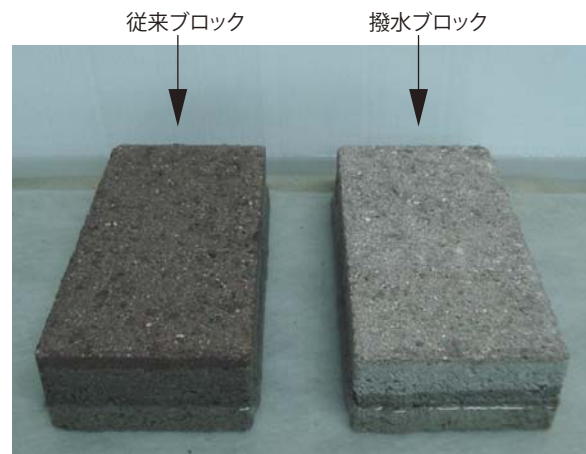
24時間後の吸水状況