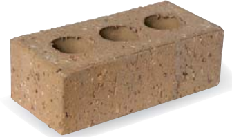
●ビクトリアングレー サイズ:L230×W110×H76(mm)