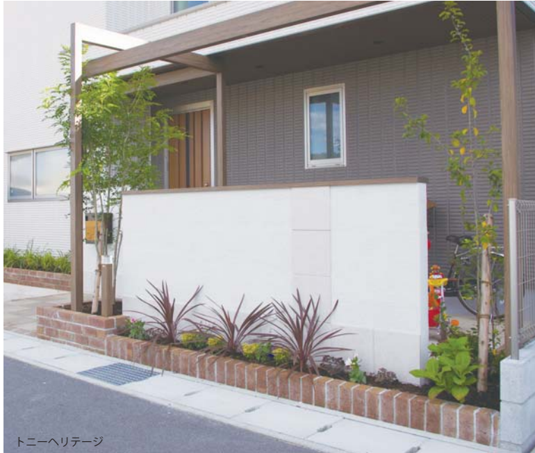
トニーヘリテージ

しっとりした焼成、気品あふれるシャープな造形が和、洋、モダンを問わずあらゆる空間を演出します。オーストラリアの大自然から生まれたセルカークは時を重ねるごとに味わい、深みを増してくれるレンガです。