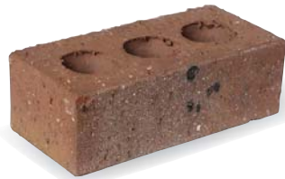
●トニーヘリテージ サイズ:L230×W110×H76(mm)