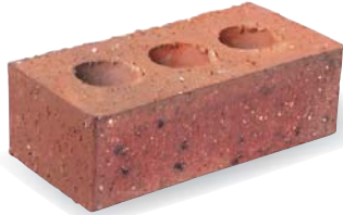
●キャニオンブレンド サイズ:L230×W110×H76(mm)