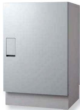
ライトグレー× メタリックシルバー (LM)